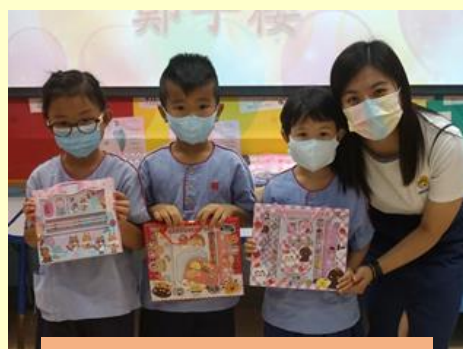
最積極分享影片家庭